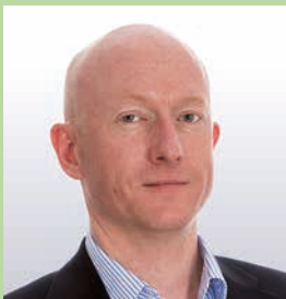
バード・リリング

教育は、資源の乏しい環境だけではなく、資源の豊富な環境でも社会を向上させるための基盤となります。