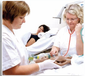
スタヴァンガー大学病院における シミュレーション