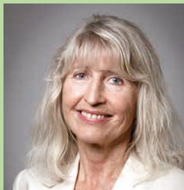
マリット・ボイエセン