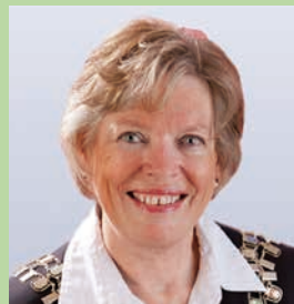
トーヴェ・カイセル

ザンビアでも、マラウイでも、ノルウェーでも赤ちゃんが誕生を迎える日に無為に命を落とすようなことがあってはなりません。