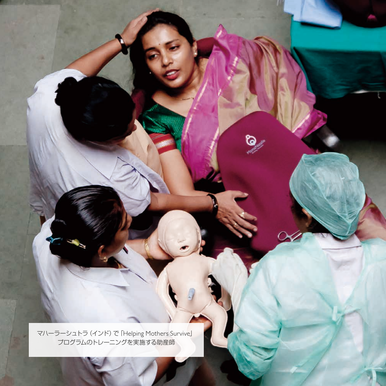
マハーラーシュトラ（インド）で「Helping Mothers Survive」プログラムのトレーニングを実施する助産師