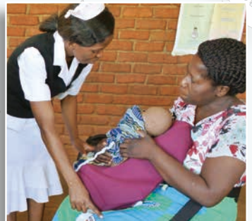
マラウイでの「Helping Mothers Survive」 トレーニング