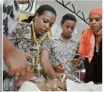
「Helping Babies Breathe」トレーニング