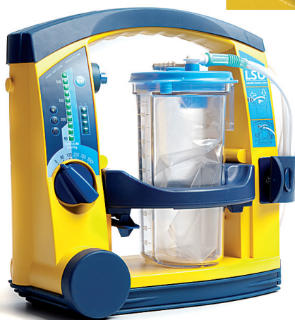
78003029 LSU con recipiente desechable, sistema Serres

*No se incluyen batería, recipientes, cables ni desgaste por uso.