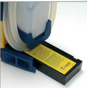
Fácil uso asegurado gracias a la batería reemplazable sin herramientas, cargador incorporado, y múltiples opciones de energía.