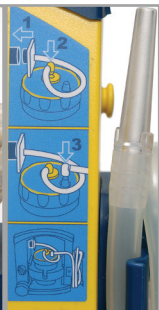
Ilustraciones explicativas de fácil comprensión