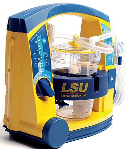
78000029 LSU con recipiente reutilizable