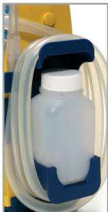
Práctico soporte del tubo de paciente