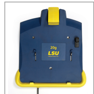
SopORTE cargador LSU

CE 0434 TCE Este producto está conforme con los requisitos esenciales de la directiva del consejo 93/42EEC; Directiva de equipos médicos según la modificación 2007/47/E