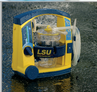
El equipo ha sido comprobado para alcanzar la clasificación IP34D, lo cual permite su uso en condiciones lluviosas sin ningún riesgo de fallo.