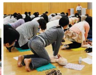
さまざまな職場で