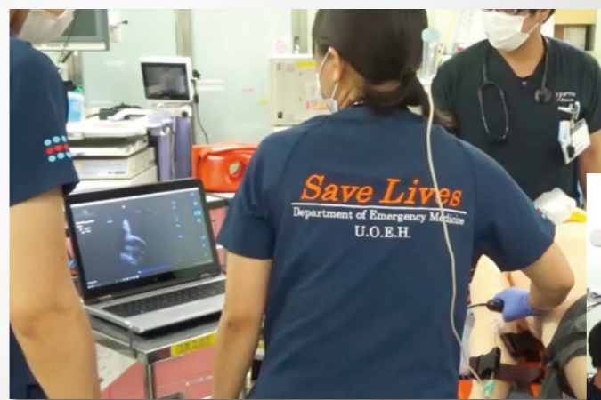
SimMan3GとSonoSim超音波ソリューションを使った超音波トレーニング

医療までいくかと言えばそこまでは無理かと思いますが、初期研修から後期研修医にかけての時期にこうしたシミュレータを使って学ぶことは大変効果的だと思います。