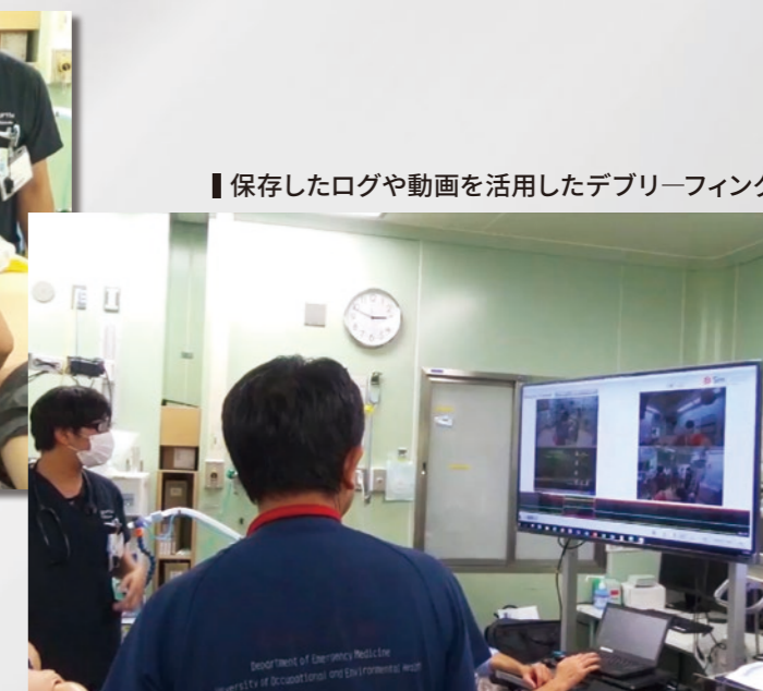
保存したログや動画を活用したデブリーフィング