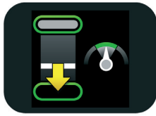
浅すぎる圧迫深度