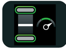
速すぎる圧迫頻度