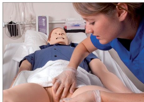
尿道カテーテルの留置