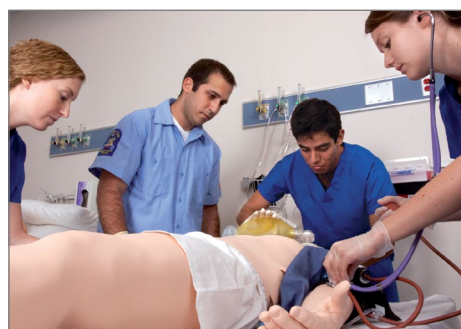
チームトレーニング